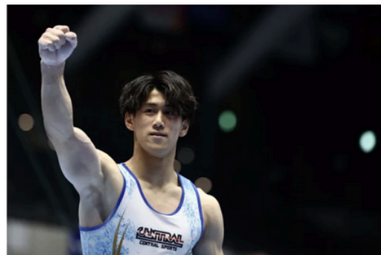
ブランド広告 起用写真